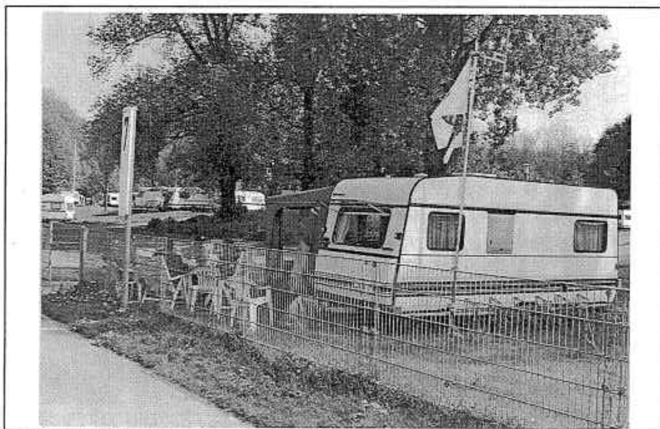
Foto: Mobile Wachstation auf dem Gelände des RKC

Rodenkirchen seit Anfang dieses Jahres über eine neue mobile Wachstation, um von dort aus die Überwachung ihres Rheinabschnitts sinnvoll zu gewährleisten. Die neue Wachstation kann nun auch als mobile Einsatz- und Koordinationsstelle bei eventuellen, zukünftigen Hochwassern verwendet werden, um direkt vor Ort des Geschehens zu sein.